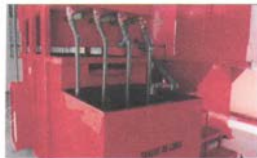
Tanque de lodos