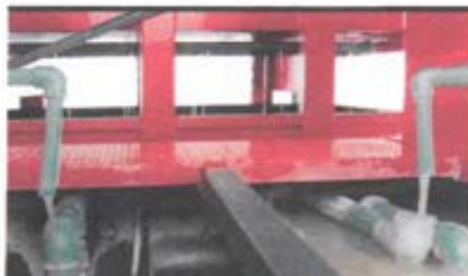
Aplicación de reactivos