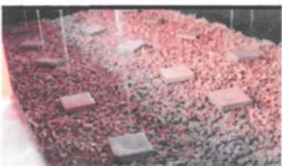
Filtro de zeolitas