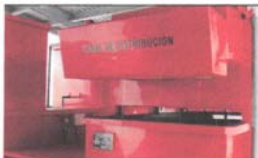
Canal de distribución