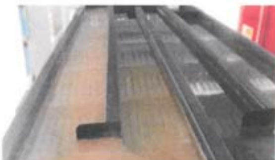
Canales de sedimentación