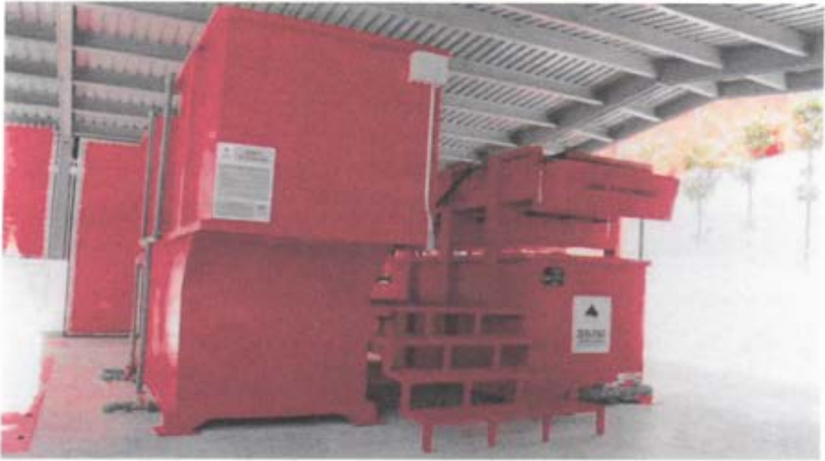
Planta de Tratamiento Comisión Municipal de Agua de Oaxaca